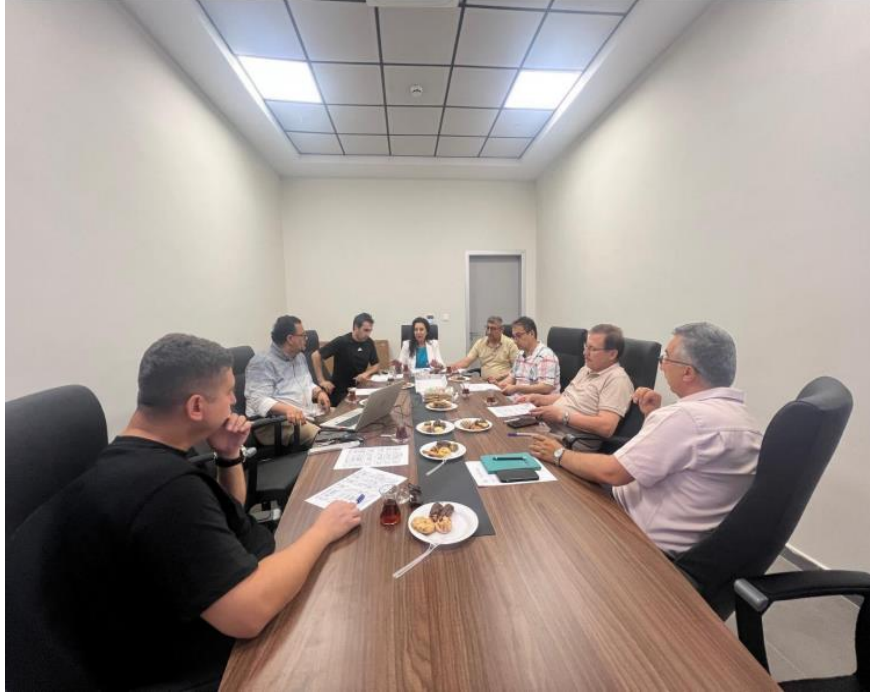
Sanat, Tasarım ve Mimarlık Fakültesi Danışma Kurulu Toplantısı - 27 Haziran 2025